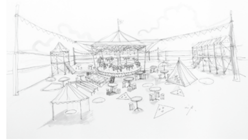
《ルーフトップ・メリーゴランド》ドローイング「おおいとイレンナーレ」2015